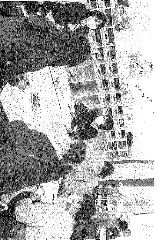
公開保育を見て感じたこと、考えたことなどを話し合った分科会の様子

公開保育でもままだ、 と、保育園でもままだ、 など、子どもたち一人一 が好きな遊びを楽しんで る。当番子どもを中心に、 動物との触れ合いを楽しむ 姿も見られる。 保育者たちは一緒に活動 を楽しみながら、子どもた ちの姿を見守っている。そ して、的確な場面で優しく 声を掛けたり、必要に応じ て環境を再構成したりして いた。