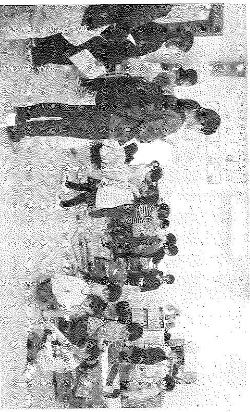
公開保育では子どもたちの遊びの様子を参加者が見学した

公開保育では、厚木緑ヶ 丘幼稚園の日常の姿を参加 者に見てもらった。登園し ては、小学校関係者、保育園 関係者、幼稚園関係者がこ こへ、サッカー、ドッジ ボール、アスチック、縄 跳び、砂遊び、こま回しな 習指導要領への問題提起も 正しく理解してもらうこと きた。そして「幼児教育を かについて試行錯誤して りをもとめていべき 1月20日に開催した。